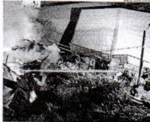
EL SINIESTRO OCURRIÓ EN UNA CASA UBICADA EN EL PASAJE JULIO ACUÑA.

Tres viviendas resultaron asimismo destruidas en el cerro Arrayán de Valparaíso, a raíz de un incendio que se inició puntado las 21.30 horas en un inmueble de material ligero ubicado en el pasaje Julio Acuña.